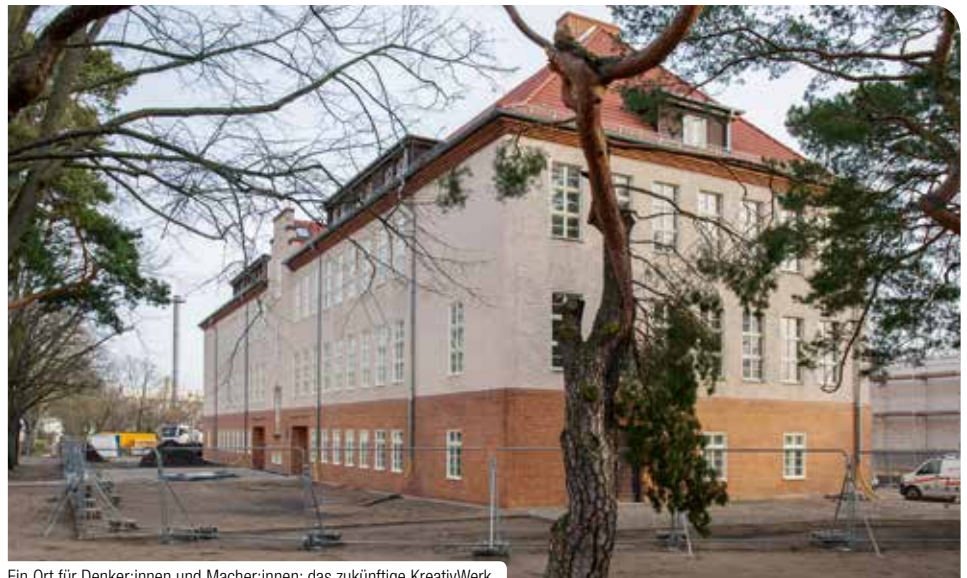
Ein Ort für Denker:innen und Macher:innen: das zukünftige KreativWerk

Mit Beginn des Jahres 2023 sollen hier unter anderem StartUps und Unternehmen in der Gründungsphase, Freiberufliche oder Selbstständige aus der Life Science Branche und der Kreativwirtschaft aber auch branchennahe Dienstleistungen Raum zur Entfaltung finden. Auf drei Etagen entstehen flexibel gestaltbare Räume in Form von Einzel- und Gemeinschaftsbüros, unterschiedlich große Besprechungsräume sowie ein großer, offen gestalteter Raum im Dachgeschoß mit einzeln buchbaren Arbeitsplätzen, wie in einem Lesesaal einer Bibliothek. Im Erdgeschoss wird es Werkstätten zur individuellen Holz- und Metallbearbeitung sowie eine Textildruckmaschine und einige 3D Drucker geben. „Damit trägt die Stadt Hennigsdorf den Herausfor-