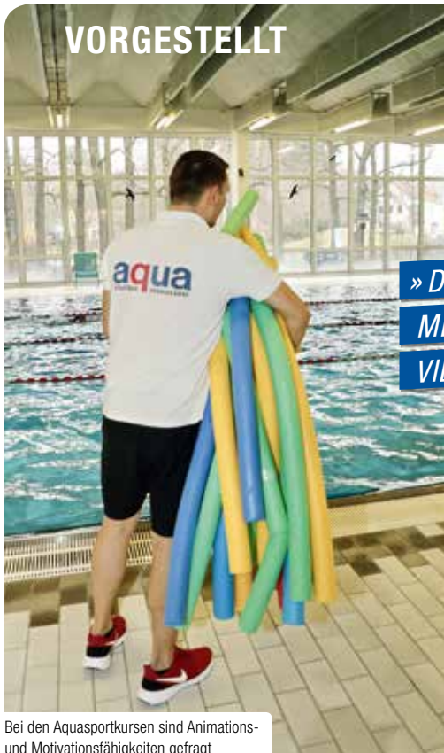
Bei den Aquasportkursen sind Animations- und Motivationsfähigkeiten gefragt