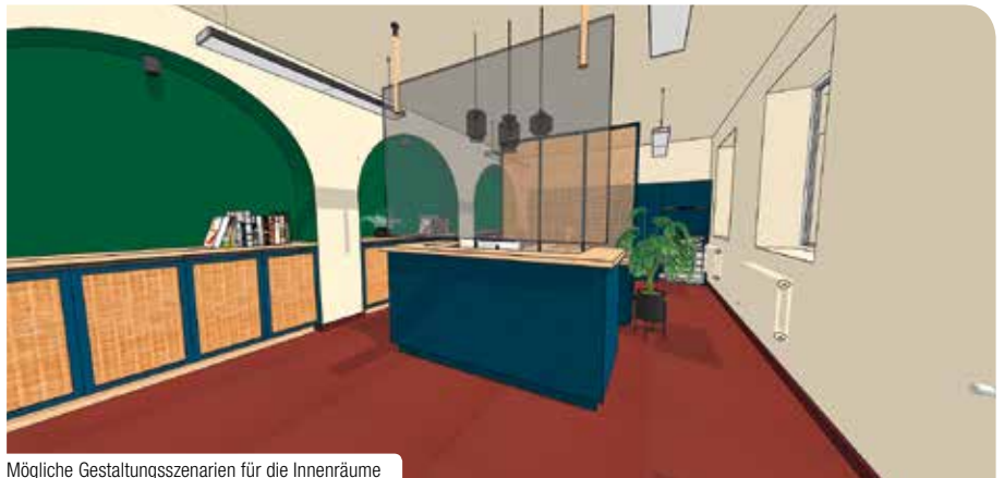
Mögliche Gestaltungsszenarien für die Innenräume

In den kommenden Monaten wird weiter intensiv am Innenausbau gewerkelt. Aber nicht nur baulich wird das alte Gebäude für die zukünftigen Nutzer:innen vorbereitet. Auch die inhaltliche Ausgestaltung des KreativWerks steht 2022 im Fokus: Da gilt es Abläufe, Preismodelle, Nutzungsverträge aber auch Beschilderungen, Marketingmaßnahmen und erste Veranstaltungen vorzubereiten und ab 2023 mit Leben zu füllen.