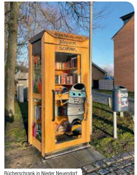
Bücherschrank in Nieder Neuendorf

Andere Vorhaben, wie das Ablegen des Sportabzeichens im Rahmen einer Breiten-